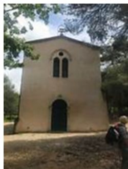
Ermitage Saint Antoine St Bauzille de la Sylve

Messe en l'honneur de Notre-Dame avec consécration à son cœur immaculé